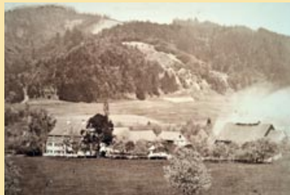
Die Glashütte Schmidsfelden noch in Betrieb, kurz vor der Stilllegung 1898