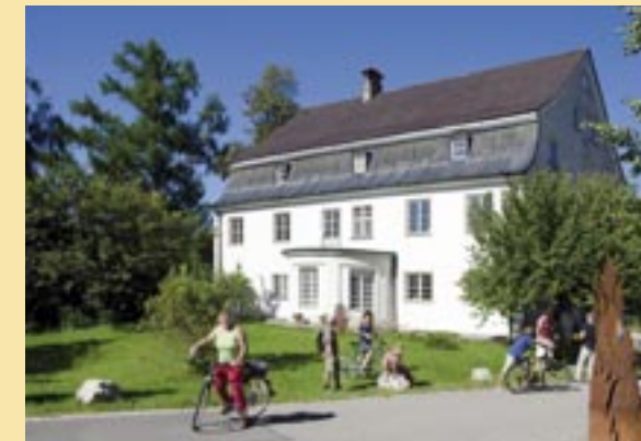
Die Residenz der einstigen Besitzer von Schmidsfelden, das Oberhaus