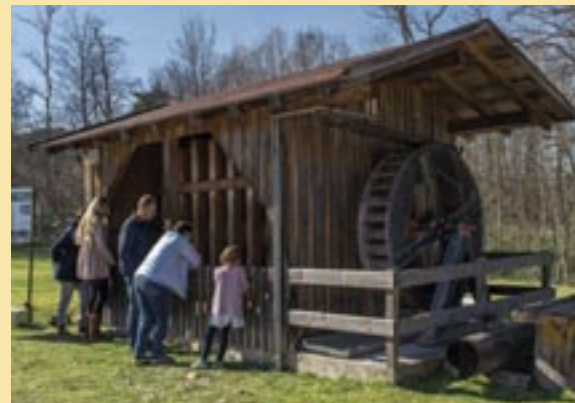
Die Steinstampfe – nur ein Steinwurf entfernt von Schmidsfelden

Einst von Gletschern umgeben, später von Glasmachern besiedelt, ist die Adelegg heute ein beliebtes Naherholungsgebiet. Der Besucherparkplatz vor Schmidsfelden ist ein guter Startpunkt für Spaziergänge und Wanderungen. Der höchste Berg Württembergs, der Schwarze Grat, bietet bei guter Sicht einen Blick über den Bodensee bis zu den Schweizer Alpen. Unterhalb des Gipfels lockt die Alpe Wenger Egg mit einer deftigen Brotzeit.