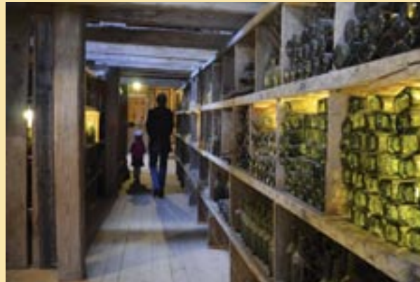
Im Glasmagazin lagern Gläser aus vergangener Zeit