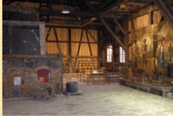
Die historische Glashütte mit den alten Kühlöfen

Im Dachgeschoss des Glasmagazins scheint die Zeit stehen geblieben: Unzählige Gläser lagern hier noch in den Regalen. Ladenhüter! In erster Linie wurden einfache Gebrauchsgläser geblasen wie Flaschen, Trinkgläser, winzige Medizinfläschchen ebenso wie riesige Ballons für Säfte und Alkohol. Im ersten Stock zeigt eine Ausstellung die Pflanzen und Tierwelt der Adelegg.