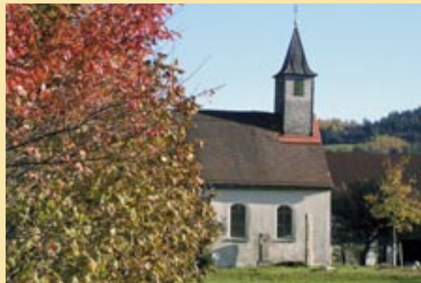
Die Agatha-Kapelle birgt einen sehenswerten Rokoko-Altar